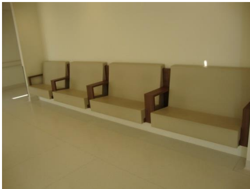
Wachtruimte op einde van afdeling.

Vooraan de afdeling vindt u de verpleegpost. Zowel in het midden als op het einde van de afdeling vindt u een wachtruimte.